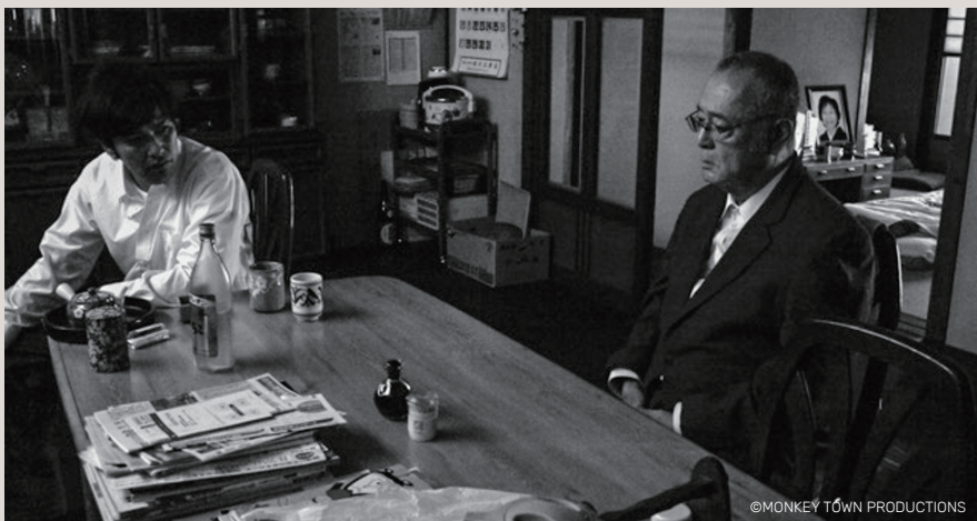
無名：仲代達矢紀念特集 Mumei: In Memory of Nakadai Tatsuya

2012 鹿特丹影展 IFF Rotterdam 2012 釜山影展 Busan IFF 2013 大阪亞洲影展特別提及 Special Mention, Osaka Asian FF