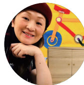
講者 | 大獅姐姐