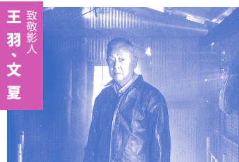
致敬影人 王羽、文夏

2013 多倫多影展 2013 東京影展 2013 台北電影獎最佳劇情長片、最佳男主角、最佳攝影、最佳音樂