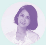
來賓 柴智屏 偶像劇教母