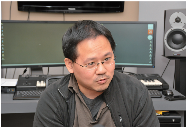
《逆光飛翔》配樂 溫子捷