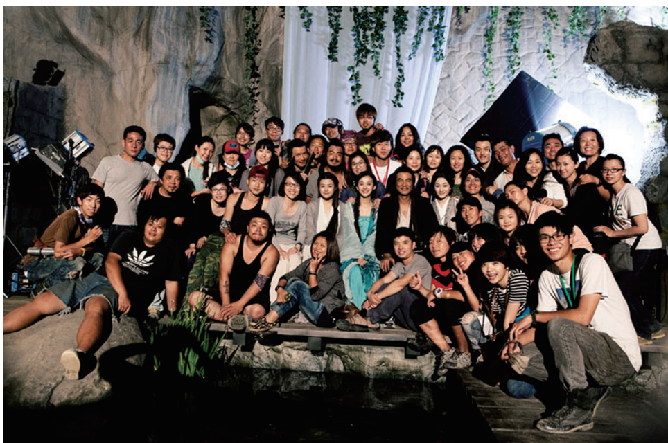
《花漾》工作人員大合照

都是現實跟夢想之間妥協後的結果。如果說，你要滿足導演最大的想像，那肯定是一個很可怕的條件：當然最好能包下一個島，重新打造成一個非常有生活感的海島，讓島上時空回到三百多年前；但這在現實中是不可能的！我能夠包下一條街就不錯了，夢想一定要跟現實面妥協。例如，我們與馬祖芹壁村合作，將整條老街封起來拍攝，但街道上有一根不可迴避的電線桿，還有亂七八糟的電線在空中劃來劃去；電線桿是古代沒有的東西，那怎麼辦？如果用特效 Key 掉，我得把那整個電線桿、包括所有電線塗成綠色或藍色，那這條街上就不能出現任何綠色或藍色的元素；而且拍攝角度嚴重受限。可是我的電影一向用色繽紛大膽，我要怎麼避掉這些顏色，更何況海面就是藍藍綠綠的。這些我實在避不掉，最後只有一條路，就是很任性地說：拔掉電線桿！我們製片組去跟台電溝通，真的請他們拔掉老街上的電線桿，提早把電線地下化，這是一個複雜的工程，但不這麼做，就沒有辦法拍攝。所以也謝謝芹壁村與台電，幫了我們這個大忙。相信這個忙，也對芹壁村的觀光景觀大有幫助。